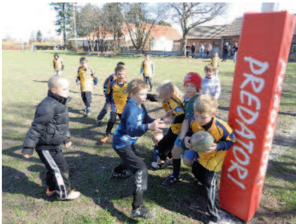
Ungdoms-mixstævne hos Speed

Vi havde en semifinale kamp imod Hundested R.K. på deres bane, desværre havde vi en del skader, men reserveerne klarede det godt. (Læs videre på side 2)