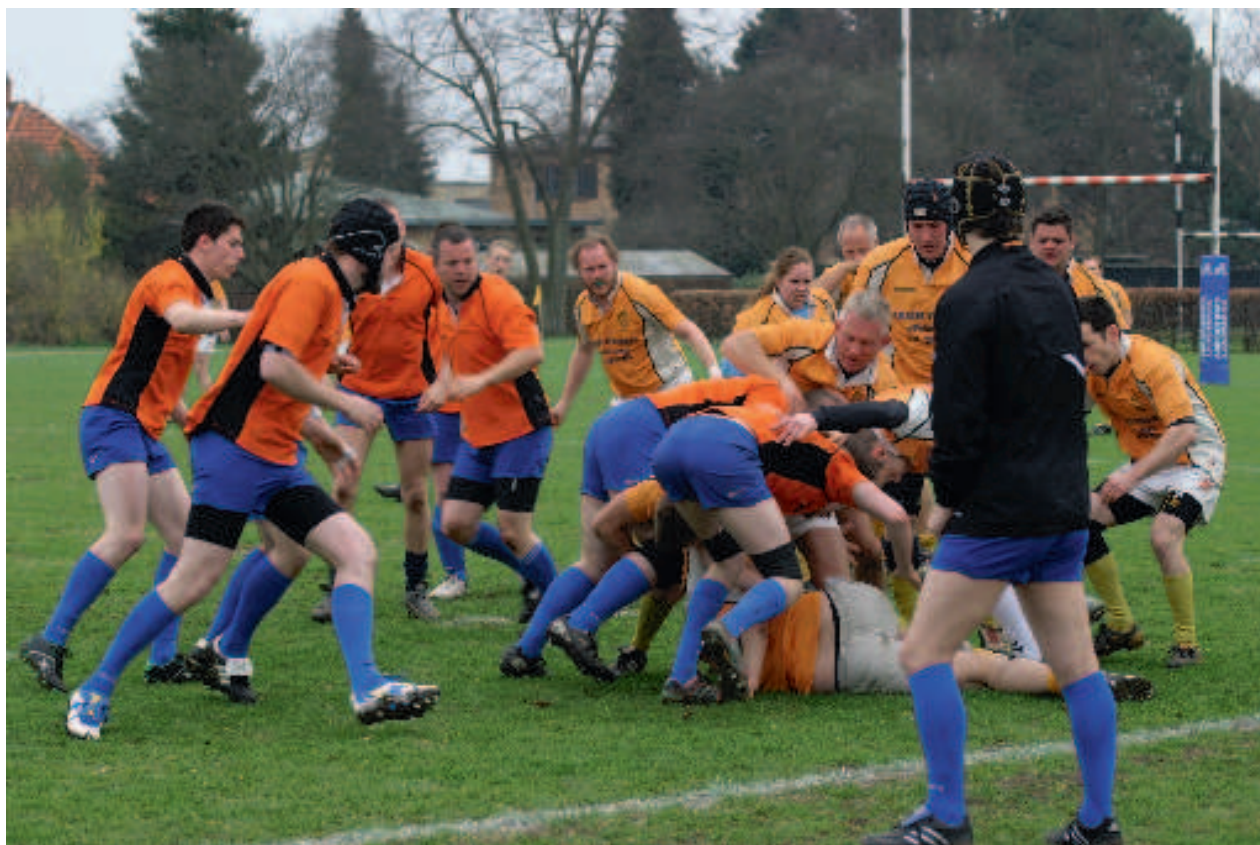
Speed 2-Roskilde Vikings